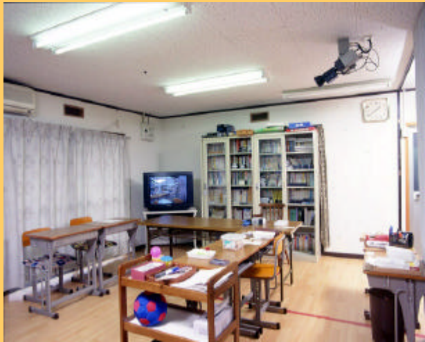
心の教室用カメラシステムのご提案

パナソニックでは心の教室に対し、高感度カメラシステムの 設置をおすすめしています。子供たちの微妙な仕草や表情 の変化を高画質映像で記録することで、その後のカウンセリ ングに有効に活かすことができると考えています。